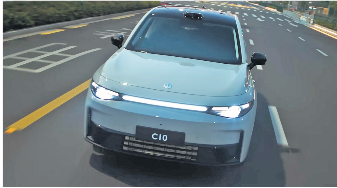
Leapmotor plans to bring in two EVs, including D-segment SUV C10, to its international markets, including India.

The company will bring in two EVs—a small electric city car called T03 and a D-segment sport utility vehicle (SUV) C10 to its international markets, including India, Leapmotor International said. Tavares, however, said Leapmotor International hasn't yet formulated a retail model for the brand in India, but it will consider utilizing Stellantis's local manufacturing facilities for Leapmotor in geographies where EVs face high tariffs.