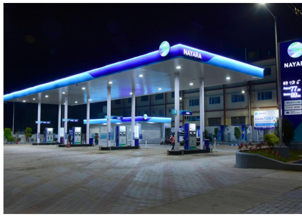
The company plans to establish two ethanol plants in Andhra Pradesh and Madhya Pradesh.

"Establishment of ethanol facilities will significantly enhance Nayara Energy's eth-