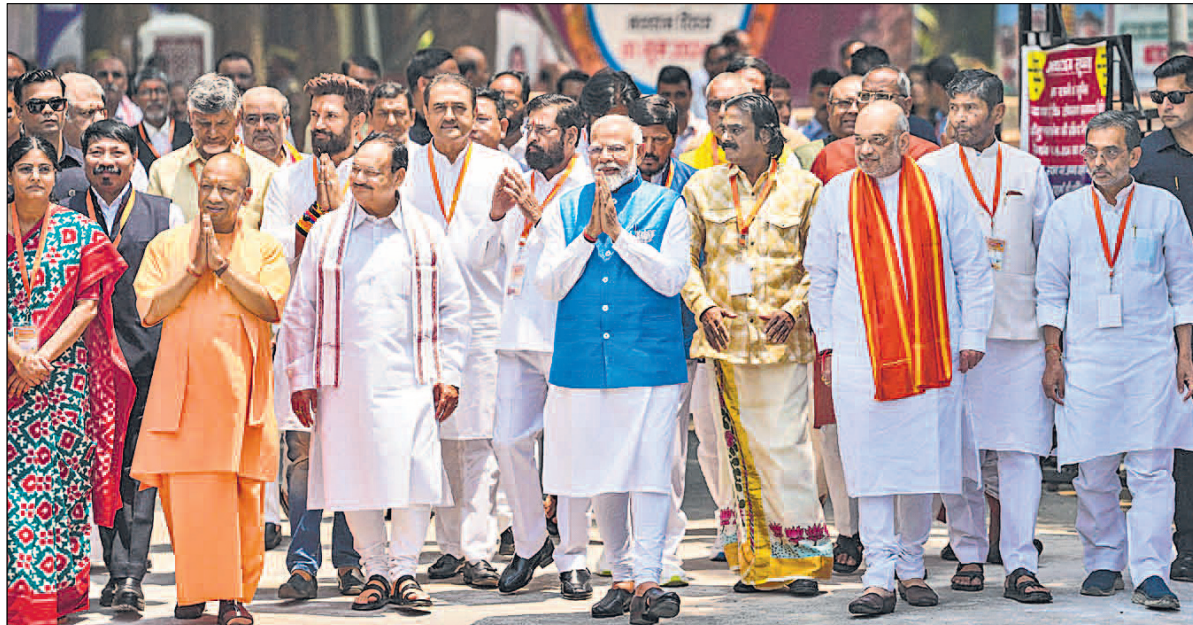
प्रधानमंत्री नरेंद्र मोदी ने मंगलवार को वाराणसी में नामांकन पत्र दाखिल किया। पचास घंटे के बाद केंद्रीय गृहमंत्री अमित शाह, भाजपा अध्यक्ष जेपी नड्डा, यूपी के सीएम योगी आदित्यनाथ और अन्य एनडीए नेताओं के साथ नामांकन कार्यालय से बाहर आते मोदी।

वाराणसी, हिटी। प्रधानमंत्री नरेंद्र मोदी ने नामांकन के बहाने काशी से बड़ा राजनीतिक संदेश भी दिया। राष्ट्रीय जनतांत्रिक गठबंधन (एनडीए) न सिर्फ दलीय आधार पर एकजुट है, बल्कि 'इंडिया' गठबंधन के उलट उसके नेताओं में सामंजस्य भी है। लोकसभा चुनाव के नजरिए से यह संदेश कितना अहम है, इसका अंदाजा मंगलवार को मोदी के नामांकन में जुटे चेहरों से लगाया जा सकता है। नामांकन के समय चंद्रबाबू नायडू, पवन कल्याण, उपेन्द्र कुशवाहा, चिराम पासवान, एकनाथ शिंदे, जीतनराम मांझी, जयंत चौधरी, रामदास अठावले, प्रफुल्ल पटेल, अनुप्राया पटेल, संजय मांझी, ओमप्रकाश राजभर जैसे नेता उपस्थित थे। पचास दाखिल करने के बाद प्रधानमंत्री सभी को साथ लेकर बिहार निकले तो वहां एक बड़े परिवार की मौजूदगी का आभास हुआ।